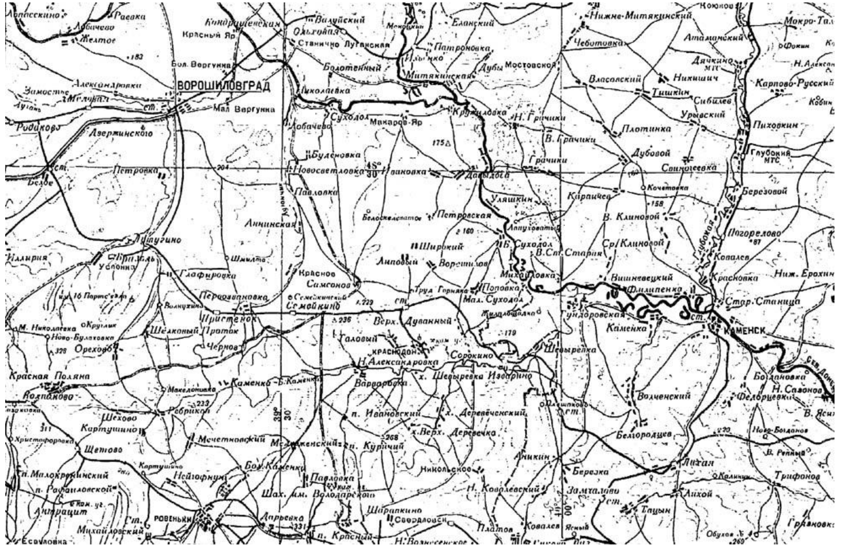
Фрагмент карты М-37Г.